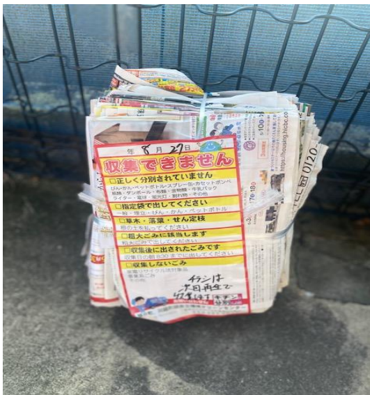
* ちらしは再生ごみ(日にち間違え) 再生ごみは A 群、B 群、C 群があります