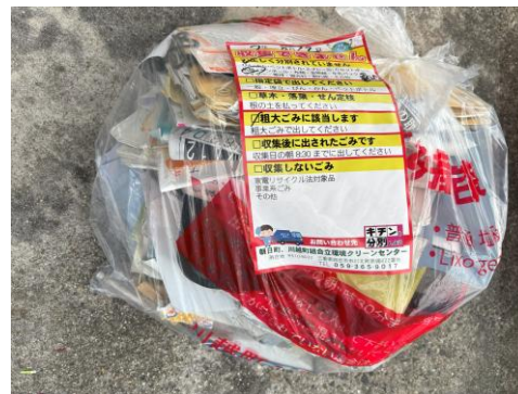
*単3電池混入(電池は粗大ごみ)