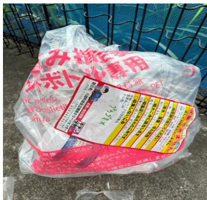
*食用油の容器混入