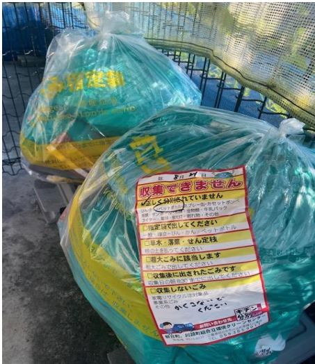
* ペットボトル混入 中身が見えない為未回収