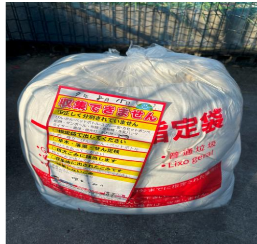
* 布団混入(布団は粗大ごみ)