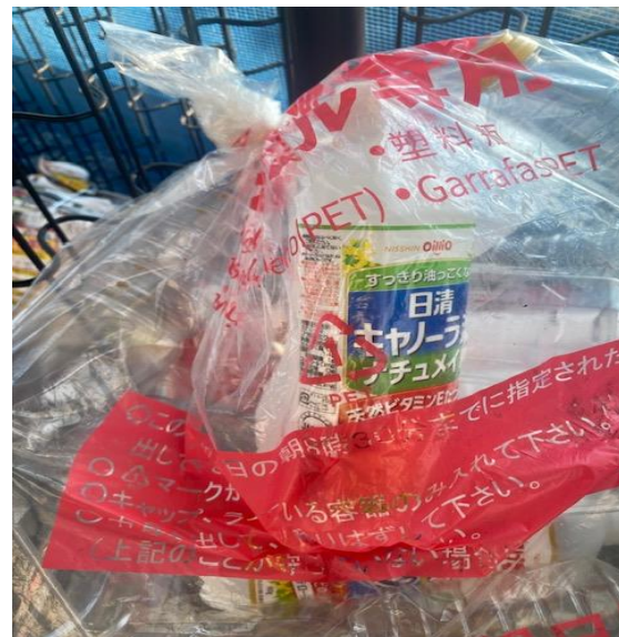
* 食用油の容器混入