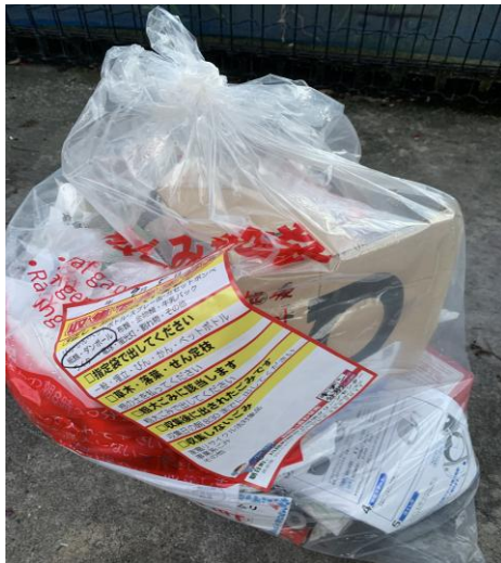
* 段ボール混入(段ボールは紐で縛り再生ごみ)