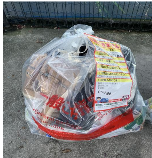
* くつ混入(くつは埋立ゴミ)