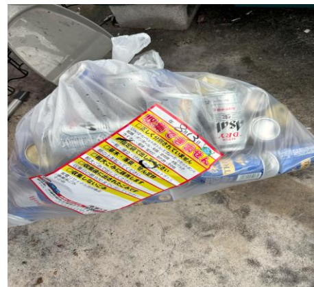
*指定袋に入っていない